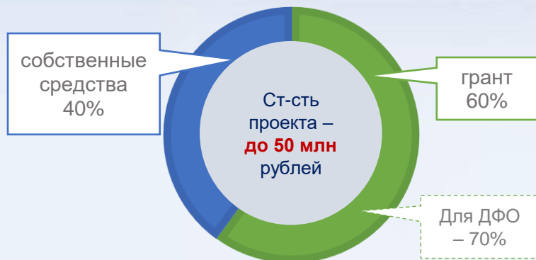
«классическая» схема финансирования стоимости проекта

30 млн рублей – на все виды деятельности