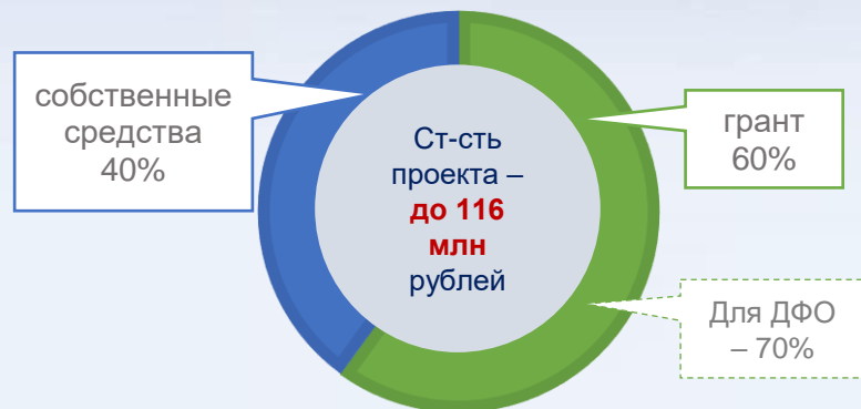
«классическая» схема финансирования стоимости проекта

70 млн рублей – на приобретение производственных объектов, оборудования, спецтехники и транспорта, мощностей для хранения продукции, торговых объектов