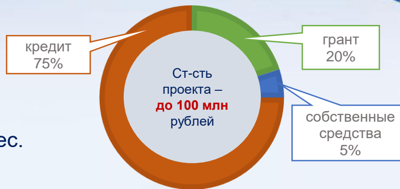
схема финансирования стоимости проекта, реализуемого с участием льготного инвестиционного кредита

Максимальная вместимость проектов животноводческих ферм – 400 голов маточного КРС, 500 усл.голов маточного МРС